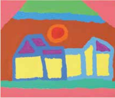
■「港水無水」アクリル、ベニア板 吉川明広(アートセンター画業/高知)

※「エイブル・アート展」は障がいのある人が「生」の証として生み出した作品を「可能性(able=エイブル)の芸術」として紹介する展覧会です。