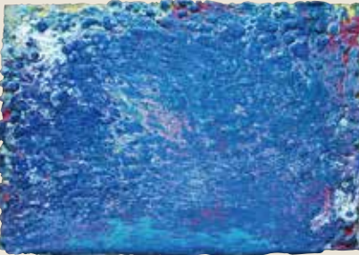
■「中央線」アクリル、パネル 大久保潤(メーブルかれん/神奈川)