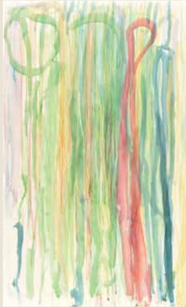
■「La Tour Eiffel」コンテパステル、 透明水彩、紙、パネル 澤井玲衣子(たんぼぼの家アート センターHANA/奈良)