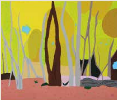
■「関谷の紅葉」アクリル、イラストボード 福島由輝也(栃木)