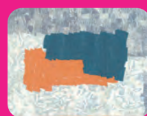
野口 昌裕 | 兵庫